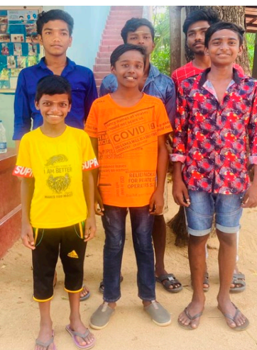
Blide gutter fra Thabovanam barneheim.