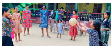
Barna leker og har det gøy.