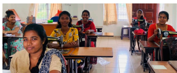
Jentene på sømkurs på senteret i Trincomalee.