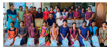
Jentene ved Anbu Illam barneheim ble glade for gavene fra givere i Norge.