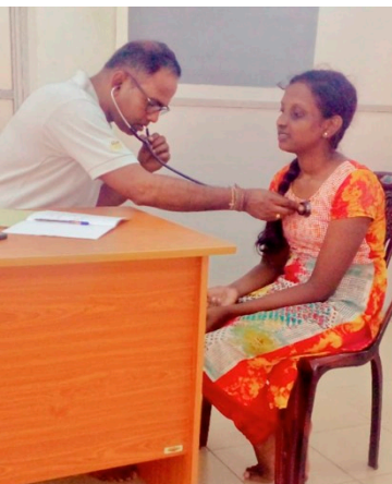
Et av barna fra barnehjem er på helsesjekk på senteret vårt.