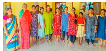
Barna på jentebarnehjemmet Sri Shanmuga med leder og assistent.